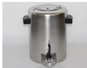
3097 / 3098