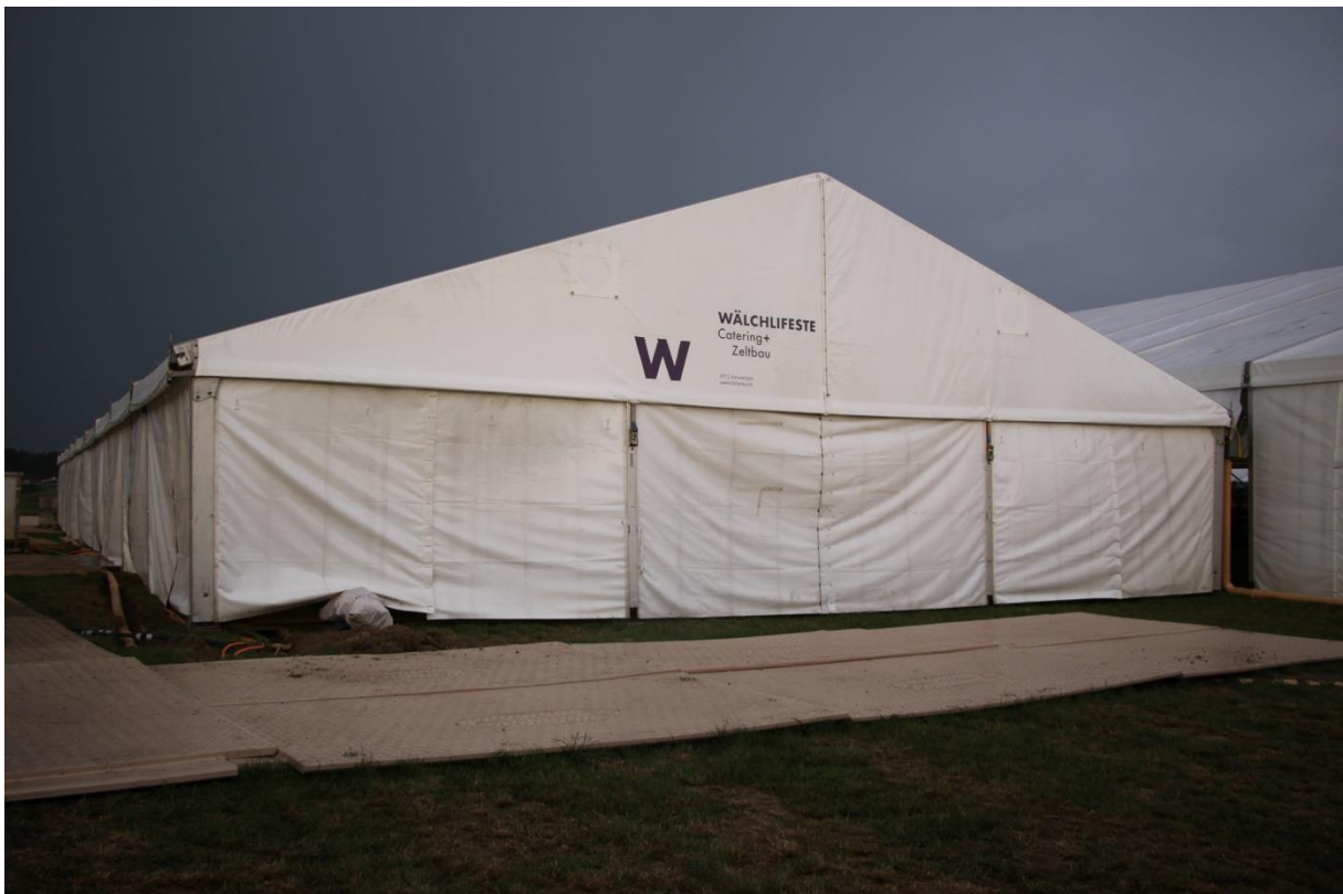
Hier als Küchenzelt